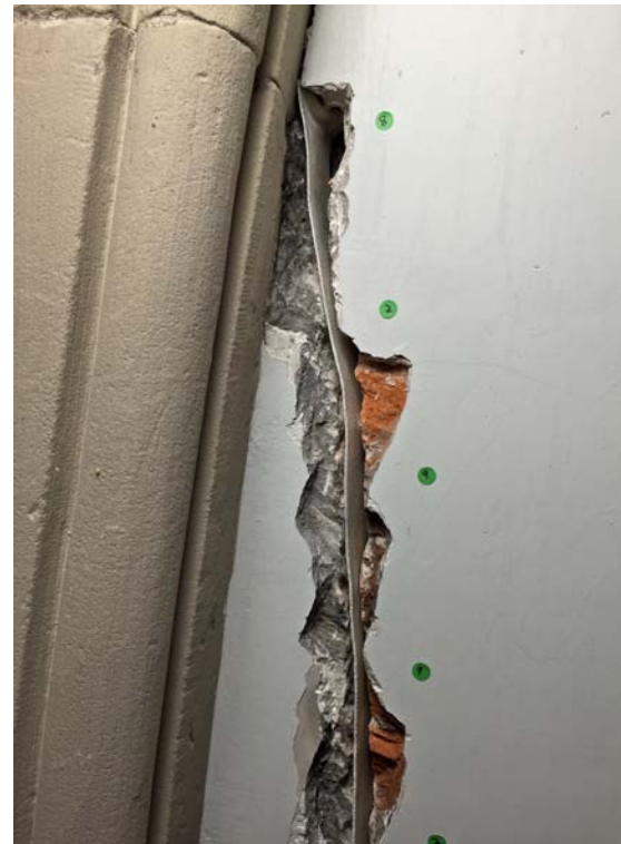
Abb. 26 In die Rissfuge wurde eine 5 cm breite Einlage aus mit Cyclododkan beschichtetem Baumwollvlies eingebaut.