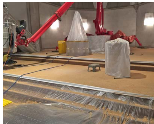
Abb. 10 Das Latexgranulat fällt zu Boden und wird anschließend mit dem Industriestaubsaugern zurückgewonnen.