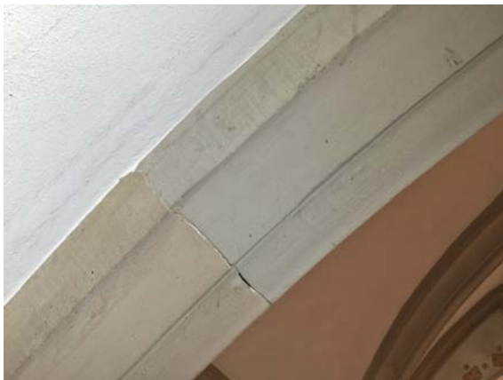
Abb. 13 Ausschnitt des Gewölbes nach der Reinigung im Saugstrahlverfahren mit Latexgranulat.