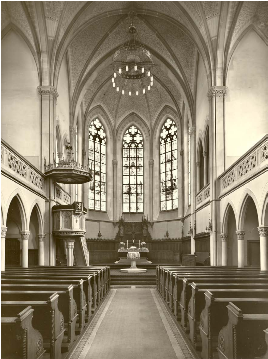
Abb. 01 Die undatierte Archivaufnahme 1 zeigt den Kirchenraum mit seiner bauzeitlichen (?) Raumfassung und Ausstattung (diese wurde bis ins 20. Jahrhundert hinein ergänzt).