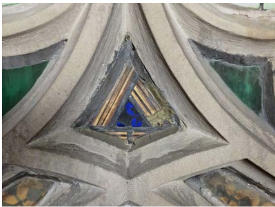
Abb. 19 Detail des mittleren Maßwerkfensters im Vorzustand.