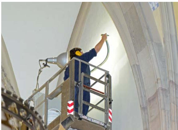
Abb. 09 Ausführung der Reinigung im Saugstrahlverfahren mit Latexgranulat.

Anhaftende Granulatreste wurden abschließend mit dosierter Druckluft entfernt.