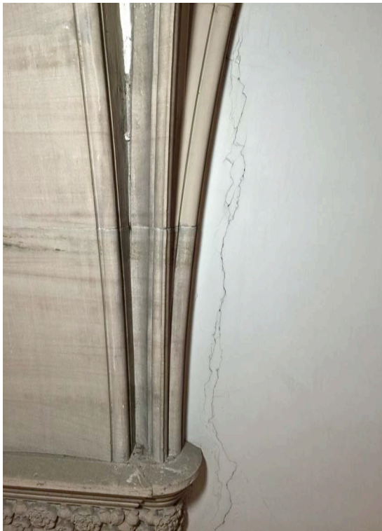
Abb. 21 Entlang der Gewölberippe SW hatte sich auf 240 cm Länge ein klaffender Riss im Ziegelmauerwerk gebildet.