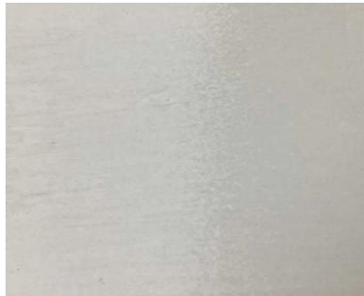
Abb. 12 Die linke Seite wurde im Saugstrahlverfahren mit Latexgranulat gereinigt.