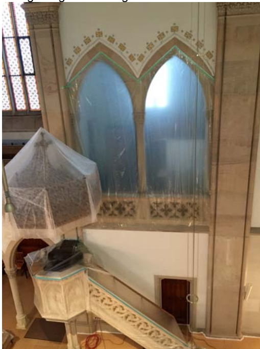
Abb. 07 Die Arkadenöffnung der Loge wurde mit Folie abgedichtet, Kanzeldeckel und -korb sind mit Vlies verhüllt.