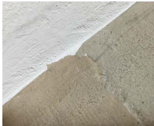
Abb. 14 Detail des Ausschnitts wie vor.