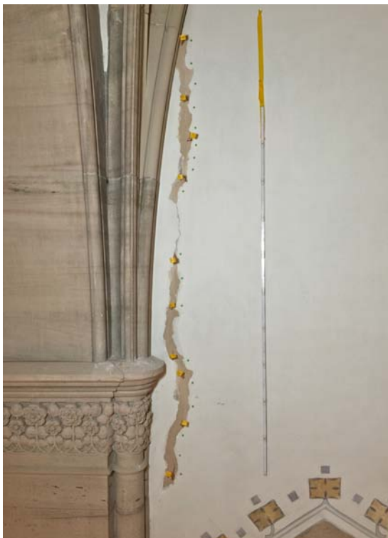
Abb. 27 Die Putzergänzung wurde in drei Lagen aufgebaut. Obwohl der originale Putz Gips enthält, wurde wegen der besseren physikalischen Anbindung bewusst reiner Kalkmörtel verwendet. Abschließend wurde eine Gipsglätte angetragen, um die entsprechende Oberfläche herzustellen.