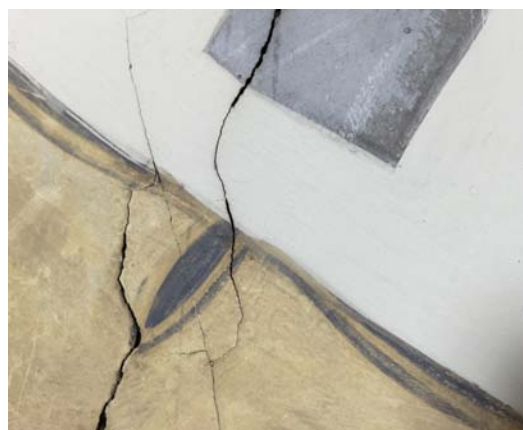
Abb. 16 Detail des Wandabschnitts wie vor.