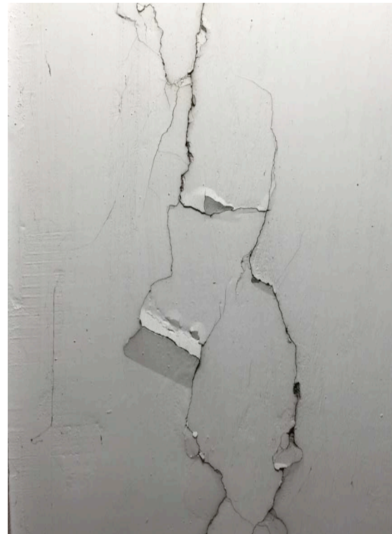
Abb. 22 Die mit Gipsmörtel ausgeführte Kittung (1972) hatte sich schon seit längerer Zeit mit Flankenrissen gelöst. In die Risse ist schwarzer Schmutz eingelagert.