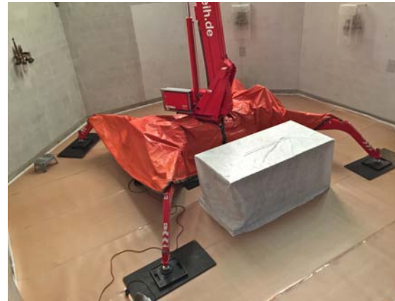
Abb. 06 Auch die Arbeitsbühne erhielt eine Schürze, um die Einlagerung von Partikeln in das Gerät zu verhindern.