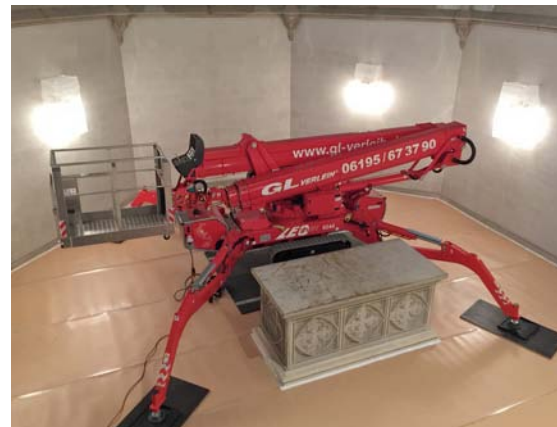
Abb. 04 Standort der Arbeitsbühne während der Maßnahmen im Chorraum. Der Bodenbelag wurde mit Milchtütenkarton abgedeckt. Die Last der Arbeitsbühne wurde mit Hilfe von unterlegten Metallplatten verteilt.