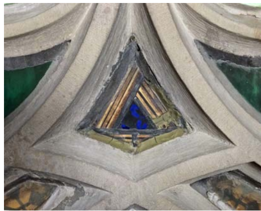
Abb. 20 Detail des mittleren Maßwerkfensters im Nachzustand. Deutlich erkennbar die Kittreparatur.