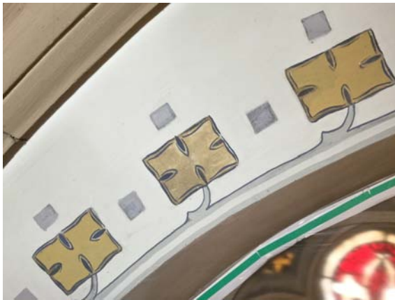
Abb. 17 Abschnitt der Wandfläche oberhalb des mittleren Fensters (Kreuzigung) im Nachzustand.