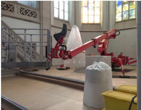
Abb. 05 Zur Vorbereitung der Maßnahmen wurden sämtliche Ausstattungsteile mit Vlies verhüllt, um Auflagerung von Latexgranulat zu verhindern.

Boden: Schutz vor Verschmutzung, Nässe und vor mechanischer Beschädigung mit Milchtütenkarton; Bahnen verklebt, Rand verklebt 5 Fenster 8 x 2 m: Staubschutz mit Maler-Spezialfolie, Verklebung auf der Rahmung des Maßwerkfensters (Überbrückung per Steinklebeband)