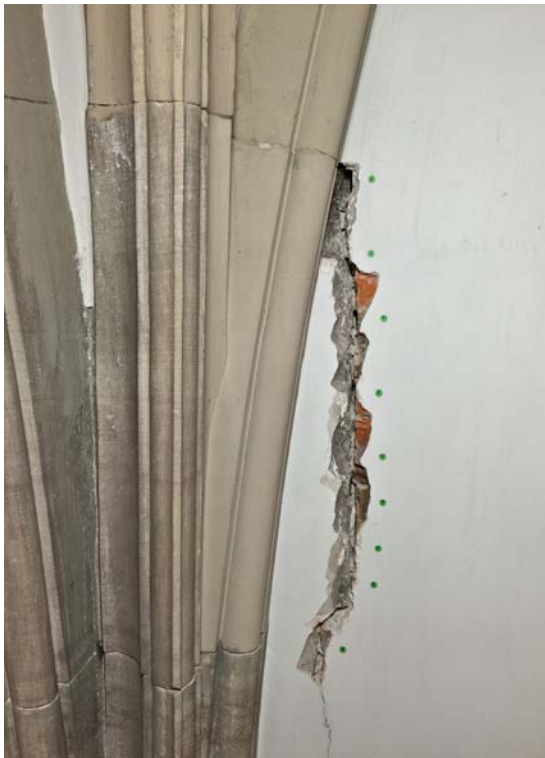
Abb. 25 Der obere Teil des Risses an der SW-Seite des Chors nach Ausbau der Gipsplombe.