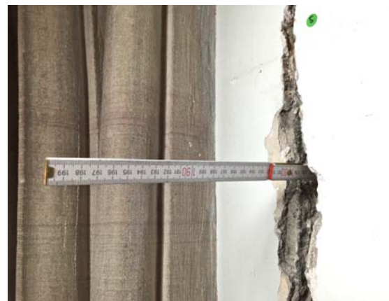
Abb. 24 In die Kluft konnte das Metermaß stellenweise auf 180 cm Länge eingeführt werden (zweischaliges Mauerwerk.)