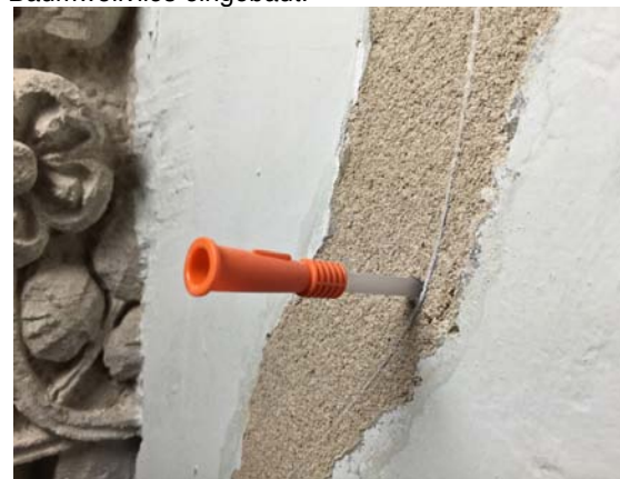
Abb. 28 An signifikanten Hohlstellen wurden Kanülen eingemörtelt, um diese mittels Mörtelinjektionen (Ledan TB1) zu verfüllen.