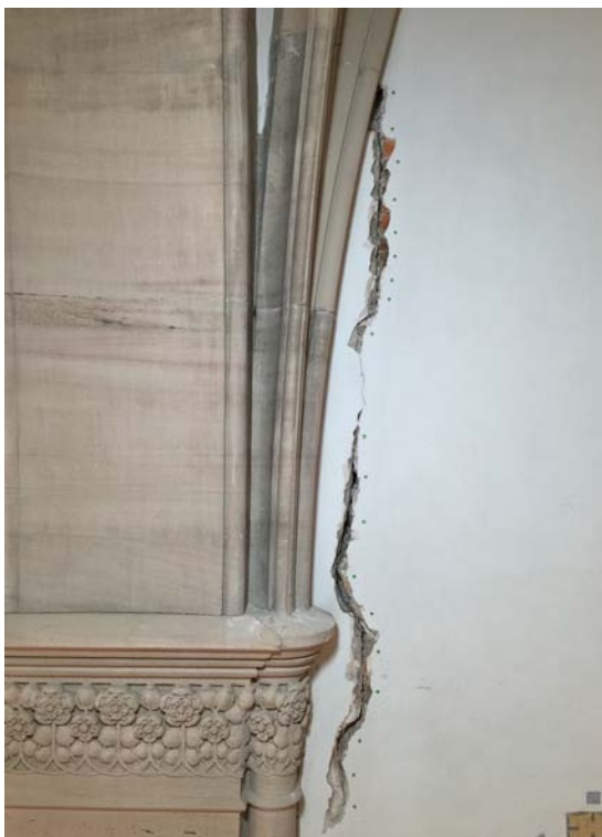
Abb. 23 Die Gipskittungen wurden vorsichtig abgenommen. Der freigelegte Spalt zeigte sich aufgrund des durch die Rissbildung ermöglichten Luftdurchtritts verschmutzt.