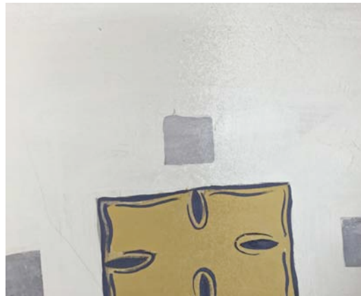
Abb. 18 Detail des Wandabschnitts wie, vor während der Reinigung im Saugstrahlverfahren. Die Fläche rechts ist gereinigt.