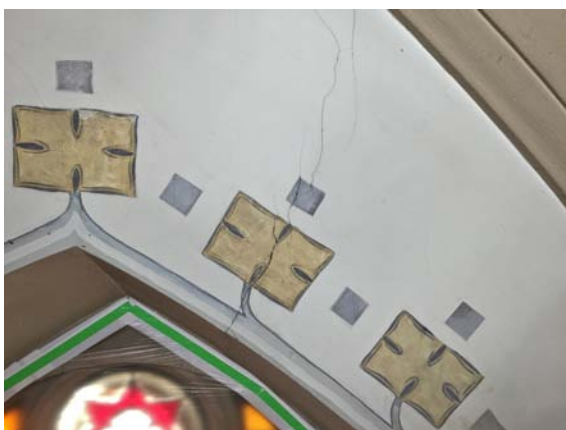
Abb. 15 Wandfläche oberhalb des mittleren Fensters (Kreuzigung) im Vorzustand.