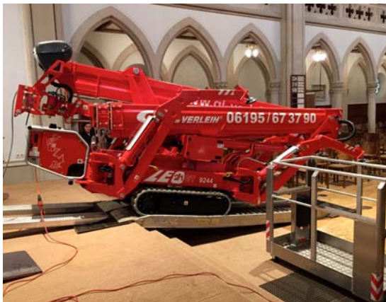
Abb. 03 Die Arbeitsbühne Teupen Leo21GT wird in den Chorraum verbracht (08.10.2014).