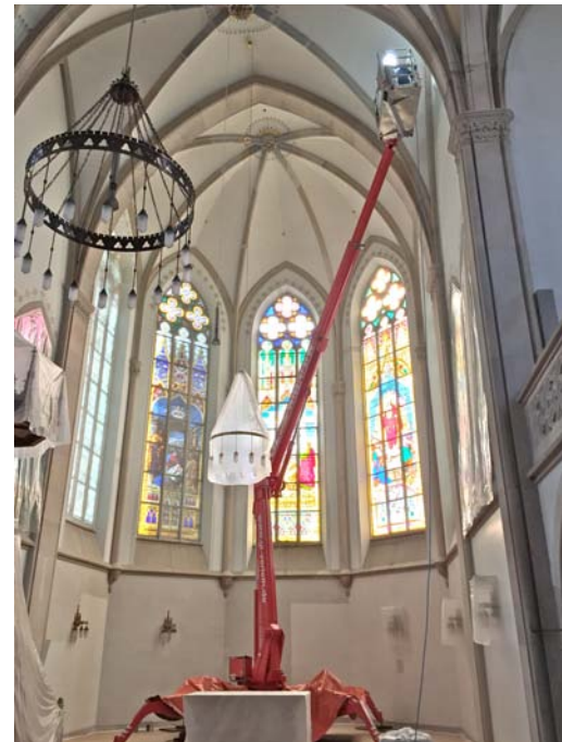
Abb. 08 Die Arbeitsbühne Teupen Leo21GT im Einsatz.